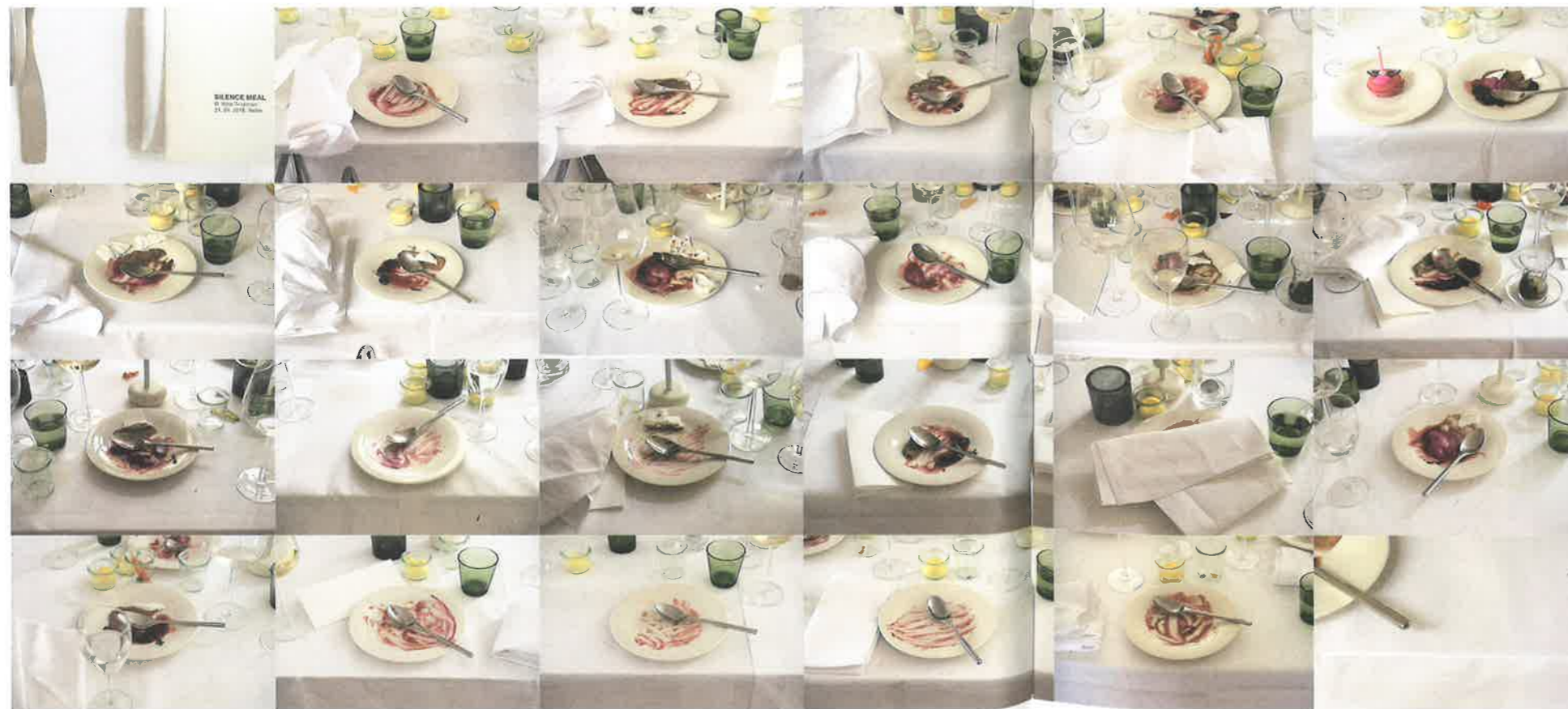
SILENCE MEAL, traces, collage

Torna naturale in qualche maniera il richiamo al lavoro di John Cage: mi confessa di aver assistito all'opera e che è stato per tanti partecipanti un argomento di conversazione e un termine di paragone, ma le modalità e gli effetti si sono delineati ben differenti. Il Silence Meal di Nina appare più come una sorta di esperimento sociale, teso a testare l'esperienza individuale del silenzio e la concentrazione sensoriale. Le interessano le relazioni comunicative tra i partecipanti, prima durante e dopo il rituale. All'inizio Nina pensava sarebbe stato un esercizio di meditazione, "dopo la performance pensavo la gente sarebbe tornata a casa calma e riflessiva, ma fu esattamente l'opposto: per molti si è rivelata come un'esperienza estrema. Il silenzio è qualcosa di molto personale e ciascuno di noi lo sperimenta nel proprio modo, un po' come il dolore. Ho capito che c'era una forte componente psicoemotiva: quando si è in silenzio non è più possibile controllare le proprie emozioni e le reazioni sono state le più disparate. Qualcuno ha iniziato a piangere, qualcuno si è arrabbiato, altri hanno iniziato a ridere nervosamente. È un'esperienza molto forte. È un modo per mettere in relazione le persone non per creare una distanza".